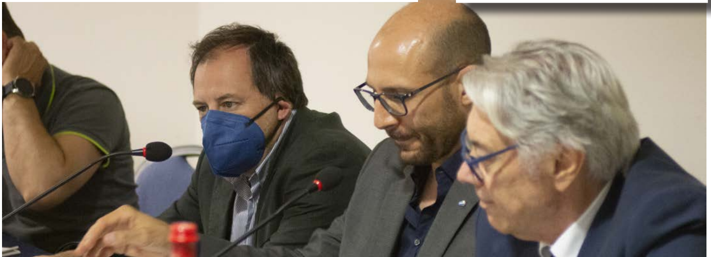
Campobasso, 16 giugno 2022