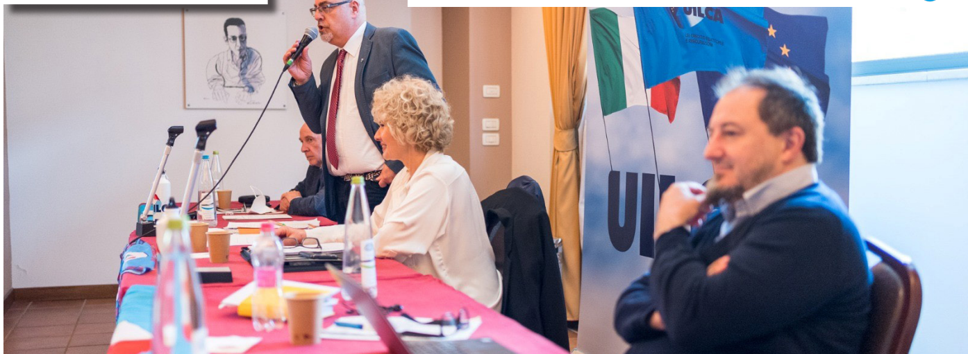
Perugia, 3 maggio 2022