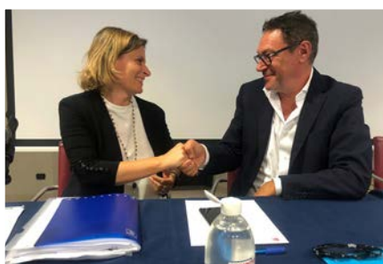
Firenze, 27 giugno 2022

“ Accetto questo incarico con molto entusiasmo e passione: per me è un onore, ma anche una grande responsabilità, perché essere sindacalisti Uilca significa porsi a servizio delle lavoratrici e dei lavoratori, offrendo loro, nella quotidianità, consulenza e risposte tempestive, servizi efficienti e tutele legali. ”