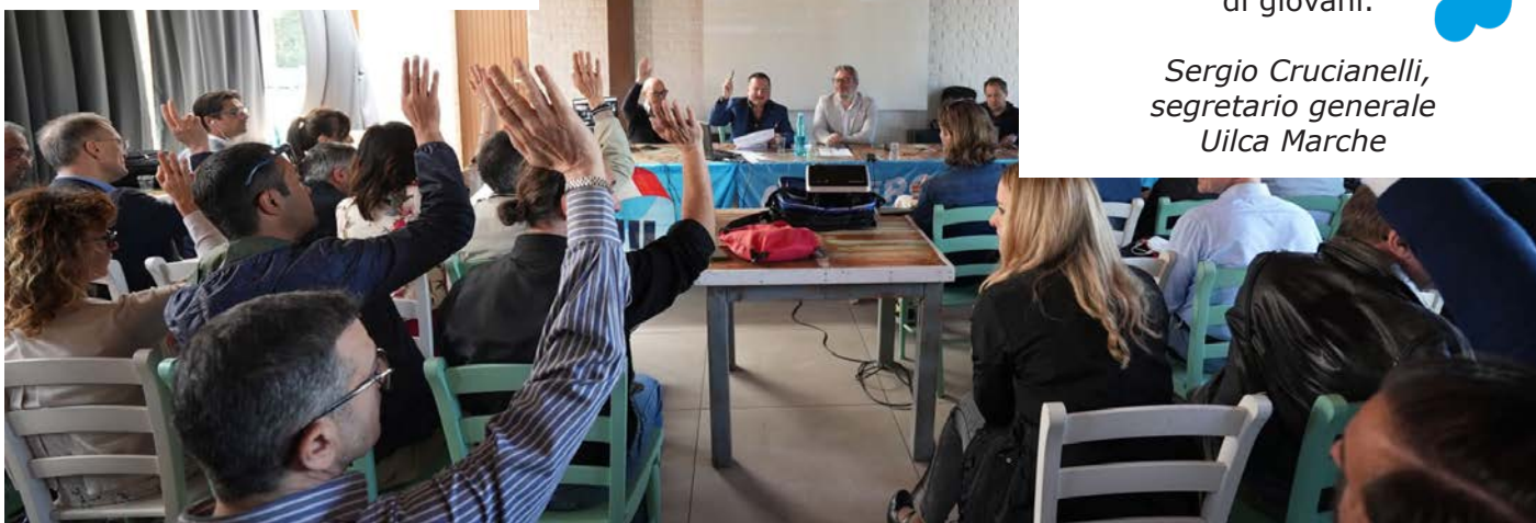
Civitanova Marche (Mc), 4 maggio 2022