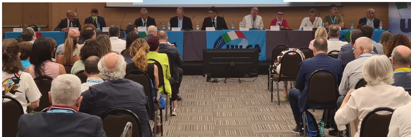
Roma, 23 e 24 giugno 2022