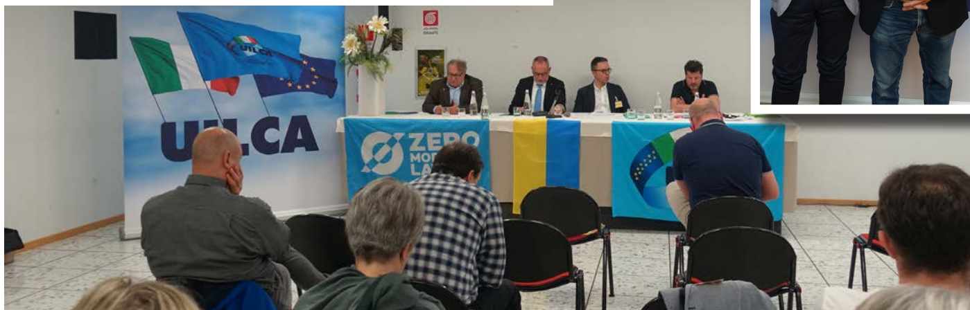
Trento, 14 maggio 2022

“ Ripartiamo dal Sud, da una sola parte, dalla parte dei lavoratori. Per una buona occupazione, contro la desertificazione per uno sviluppo sostenibile e la valorizzazione delle persone. Noi ci siamo! ”