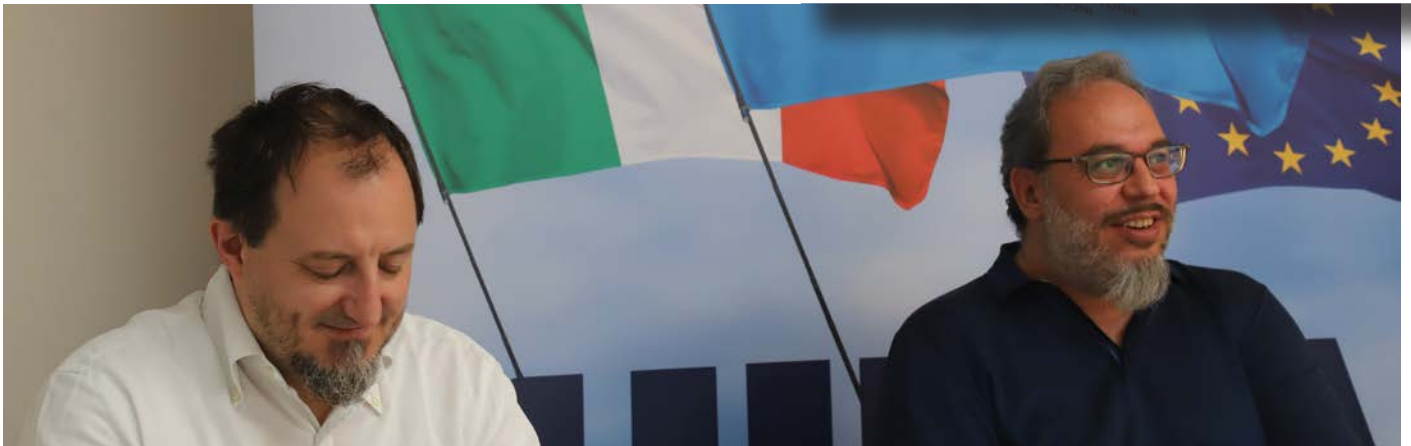
Bolzano, 23 maggio 2022

“ Ripartiamo consapevoli di avere un gruppo di Quadri di altissimo livello, pronti ad affrontare tutte le sfide che ci attendono con in mente un solo obiettivo: lavorare al meglio nell’interesse dei nostri iscritti. ”