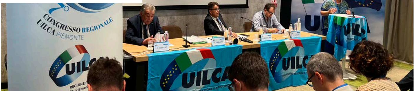
Torino, 6 giugno 2022