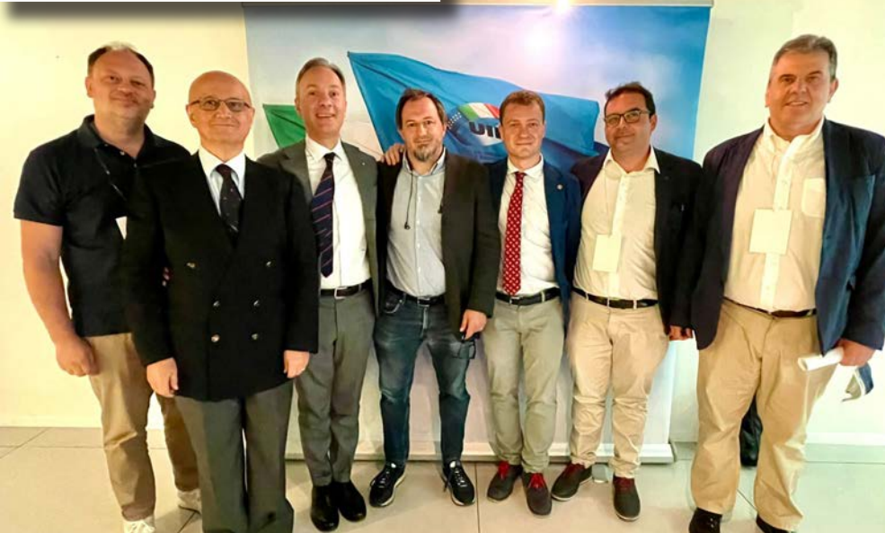
Potenza, 16 giugno 2022

“ Il Molise esiste e resiste, condividendo la strada maestra con nuovi e vecchi compagni che hanno dedicato al Sindacato l’esperienza di tutta una vita trascorsa al fianco delle lavoratrici e dei lavoratori. ”