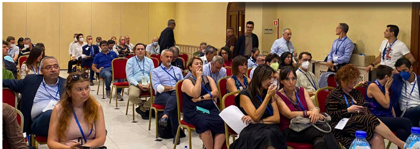
Bologna, 22 giugno 2022