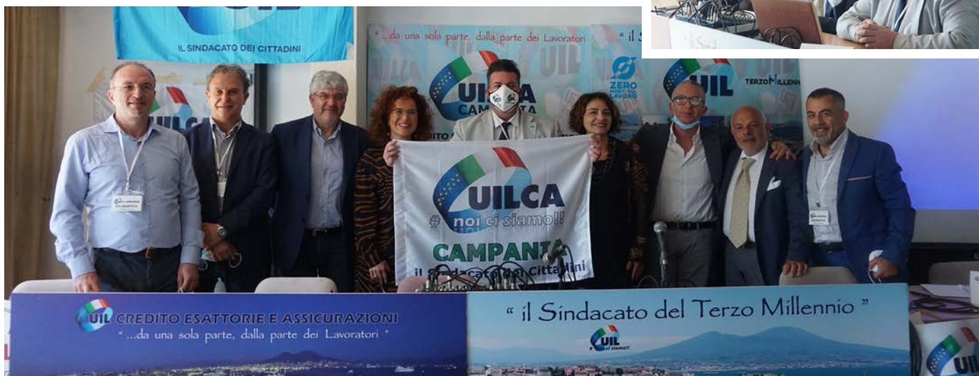
Pozzuoli (Na), 21 maggio 2022