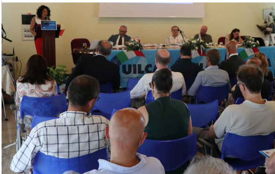
Monfalcone (Go), 23 giugno 2022

“ Il motto del Congresso Uilca Lazio è stato “liberiamo energie, facciamo squadra”. Sarà questa la base di partenza per il nostro lavoro presente e futuro. ”