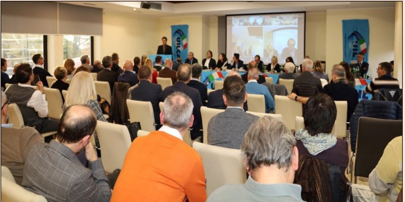
Immagine dalla platea dell'Assemblea Congressuale della UILCA Gruppo BNL

Alle scriventi Organizzazioni Sindacali è giunta voce di una strana "campagna" che la banca starebbe realizzando in relazione all'accompagnamento di alcuni lavoratori alla pensione.