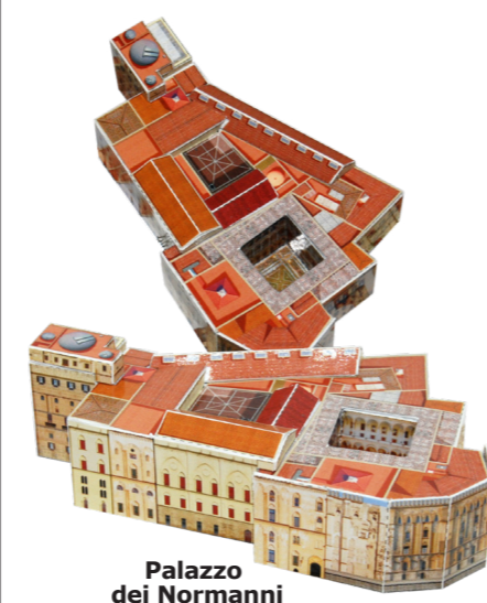
Palazzo dei Normanni

3 UILCA: Sud con più banche e più occupazione di Valentina Bombardieri