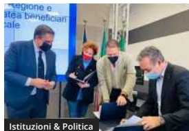
Istituzioni & Politica

Precariato dell'informazione, Uil Liguria: "Serve un patto contro lo sfruttamento"