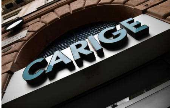
Carige: Fondo interbancario approva la cessione a Bper