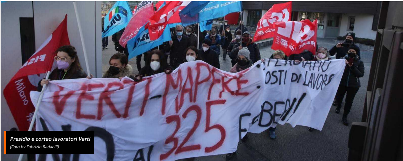
Presidio e corteo lavoratori Verti

HOME / ECONOMIA / VERTI, TRATTATIVA SUI 325 ESUBERANTI IN STALLO. MA C'È UN PROTAGONISTA IN PIÙ: I SINDACATI INCONTRANO L'ANIA, L'ASSOCIAZIONE DELLE IMPRESE ASSICURATRICI