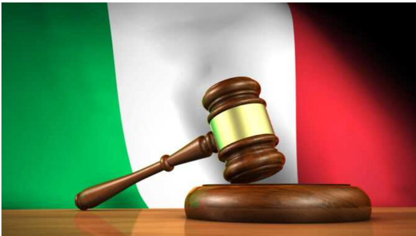
Approvata in via definitiva la norma che risolve il problema degli avvisi agli ex esodati