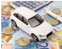
Rc auto, premio medio in calo