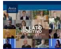
Il programma tv di Ania e Fondazione Ania in onda su Rai 2