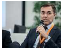
La ricetta antifrode di Metakol